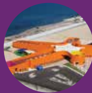
Baja California Sur