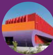
Ciudad de México